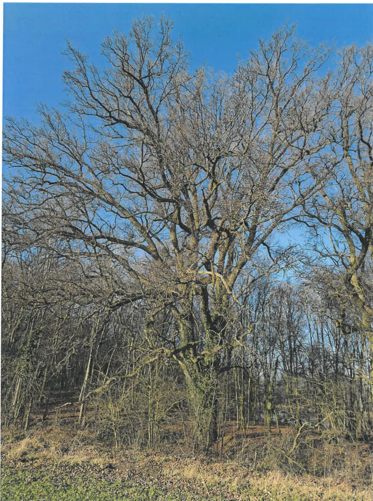
Dąb szypułkowy ( Quercus Robur L. ) „Mścislaw” rosnący w miejscowości Niechmirów na działce o numerze ewidencyjnym 67/15, obręb 0018 Niechmirów PGR, gmina Burzenin.