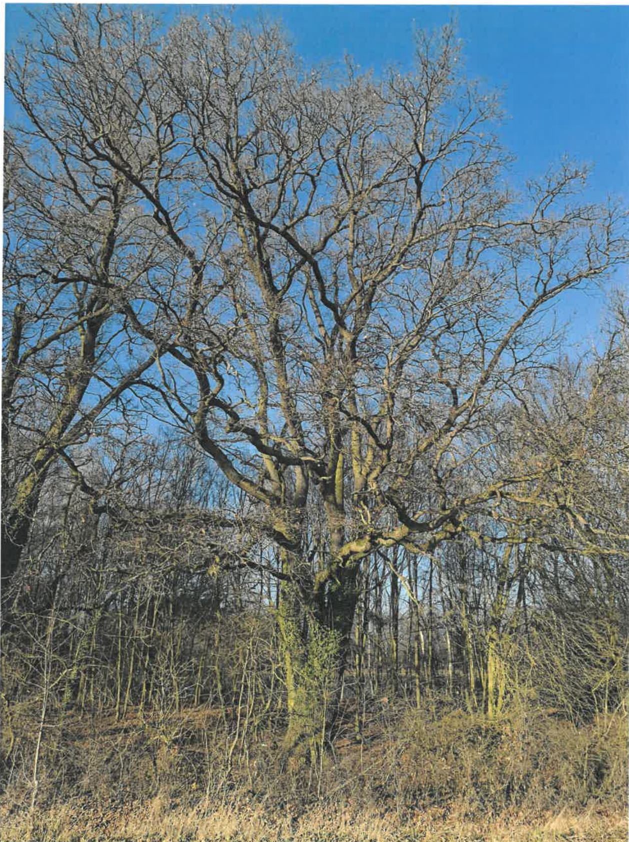
Dąb szypułkowy ( Quercus Robur L. ) „Krystyna” rosnący w miejscowości Niechmirów na działce o numerze ewidencyjnym 67/15, obręb 0018 Niechmirów PGR, gmina Burzenin.