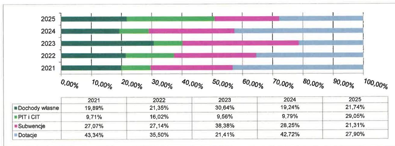
Wykres 2: Dochody Gminy Burzenin wg kategorii w 2025 roku w porównaniu do lat 2021-2024

*z uwagi na pośredni charakter w ramach zestawienia z dochodów własnych wydzielono PIT i CIT